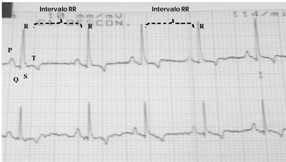
Figura 1. Ritmo sinusal regular en canino de la raza Perro sin Pelo del Perú (derivación I y II; 25 mm/s; 10 mm/mV). Las ondas P y los complejos QRS son normales, y los intervalos PR y RR son casi constantes