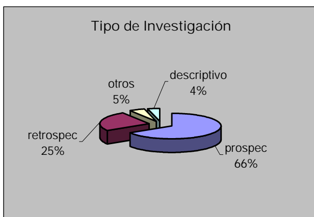
Gráfico N° 4

La gran mayoría de los artículos son prospectivos (66%). Se hallaron un metanálisis (6) y 2 estudios multicéntricos (7) (8), (gráfico N° 4).