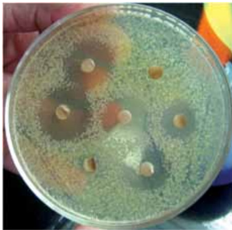
Fig. 2. Observar el halo de inhibición obtenida por C. spinosa , a una concentración de 25 mg/ml (disco central) sobre flora mixta salival.

1 Valores de sensibilidad en el aromagrama según Duraffourd