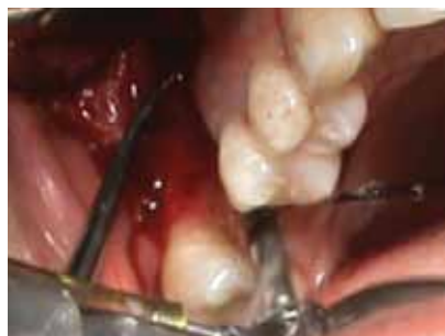
Fig 5. Separación de la membrana sinusal con cureta