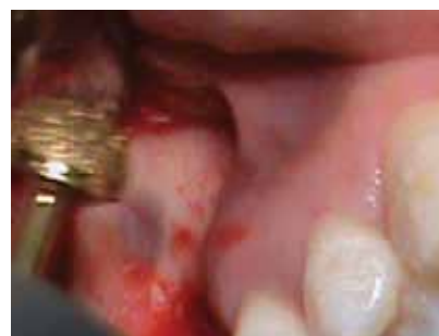
Fig 4. Fresado externo con DENTIM DASK No. 5