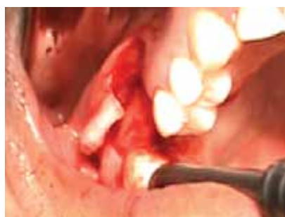
Fig 3. Colgajo de espesor total

Se indicó analgésicos: Dexametazona 4mg (amp), Ketorolaco 60mg (amp), Naproxeno 550mg (comp).