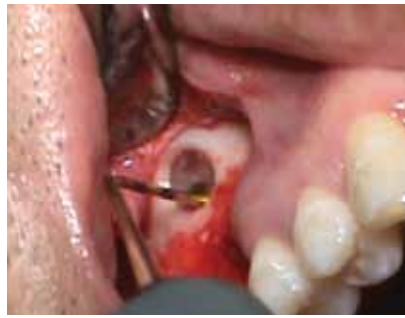
Fig 8. Colocación del implante dental