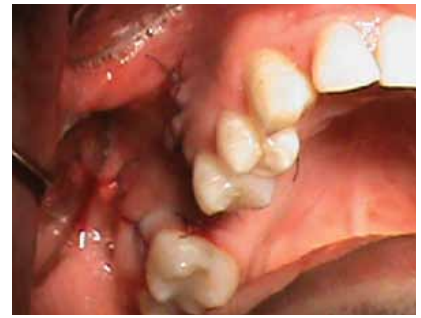
Fig 9. Sutura