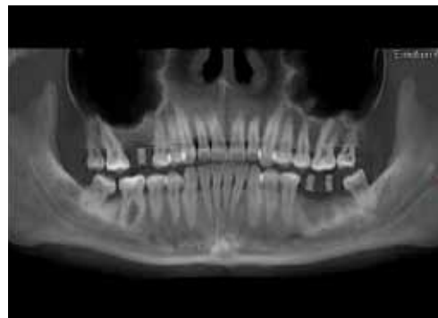
Fig 2. Corte seccional a nivel del diente 16

El plan de tratamiento propuesto fue la colocación de un injerto sinusal con abordaje en la pared lateral y colocación simultánea de un implante dental.