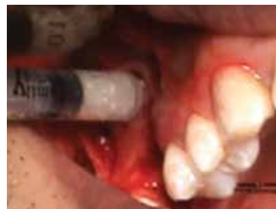
Fig 6. Osteotomía para colocación del implante