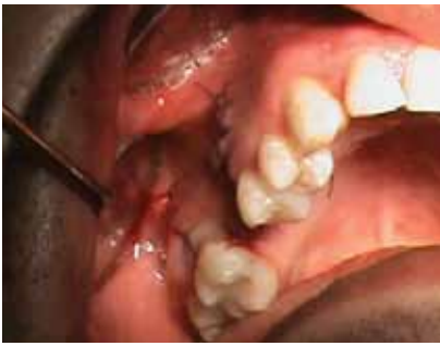
Fig 7. Inserción del relleno óseo