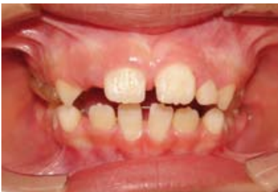
Figura N.º 14