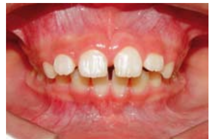
Figura N.º 19