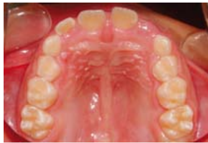
Figura N.º 15