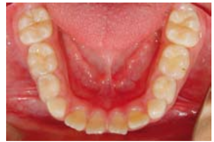
Figura N.º 16