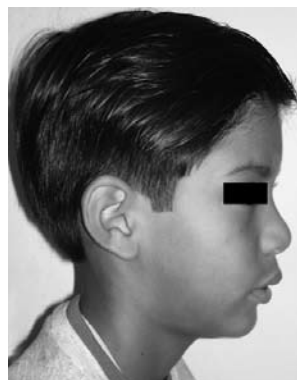
Figura N.º 3