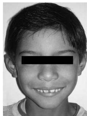
Figura N.º 2