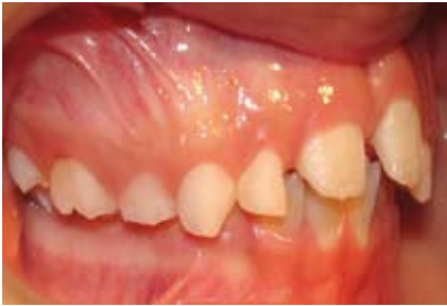
Figura N.º 8