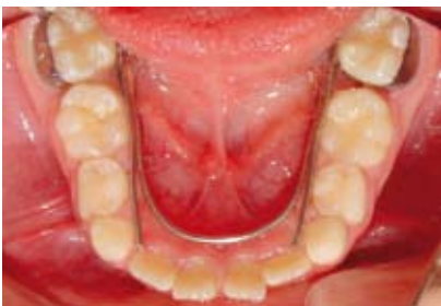
Figura N.º 11