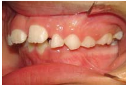
Figura N.º 9