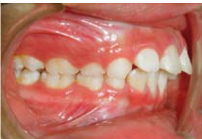
Figura N.º 17