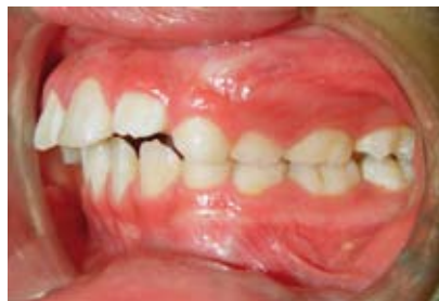
Figura N.º 18