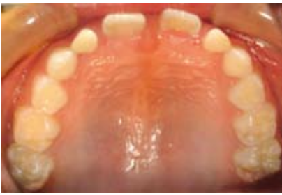
Figura N.º 5