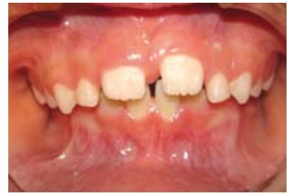
Figura N.º 7