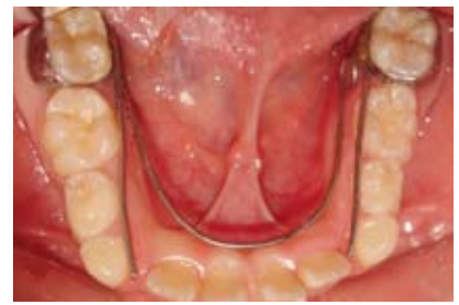
Figura N.º 13