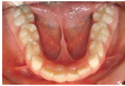
Figura N.º 6