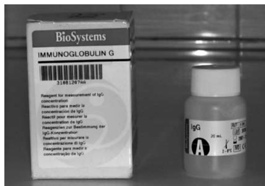
Figura N.º 1. Reactivos utilizados para la determinación de absorbancia de IgG.

La primera fase del análisis de laboratorio fue la de determinar la absorbancia de la muestra para IgG utilizándose un espectrofotómetro Spectronic 21 (Fig. N° 2). Las muestras de saliva total almacenadas se descongelaron al medio ambiente. Para obtener una mayor uniformidad de la muestra se le centrifugó a 5000 RPM por 10 minutos. Se pipetearon 750µL del reactivo para IgG y se colocan en la cubeta de medición añadiéndoles 5µL de la muestra. Se realizó la primera medida en el espectrofotómetro a 540nm. Se colocó la cubeta en la incubadora a 37°C por 5 minutos. Luego de 5 minutos de la adición de la muestra se realizó una nueva lectura en el espectrofotómetro a 540nm. La diferencia de la primera y la segunda lectura se consideraba como la absorbancia de la muestra.