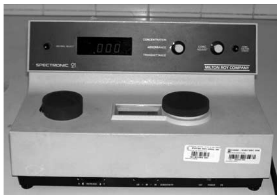
Figura N.º 2. Espectrofotómetro utilizado para medición de absorbancia de IgG.