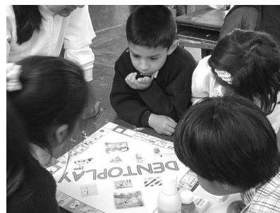
Fig 1,2. Método didáctico basado en juego de reglas.

Al término de la investigación se llegó a las siguientes conclusiones: