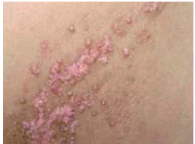
Fotografía 2. Pápulas eritematosas con costras superficiales e hiperpigmentación periférica en región escapular.

Se realizaron exámenes hematológicos y bioquímicos con resultados dentro de parámetros normales. En el estudio histopatológico se evidenció un patrón de dermatitis crónica psoriasiforme con marcada hiperqueratosis y formación de lamellae corneae en la capa córnea ( Fotografías 4 y 5 ).