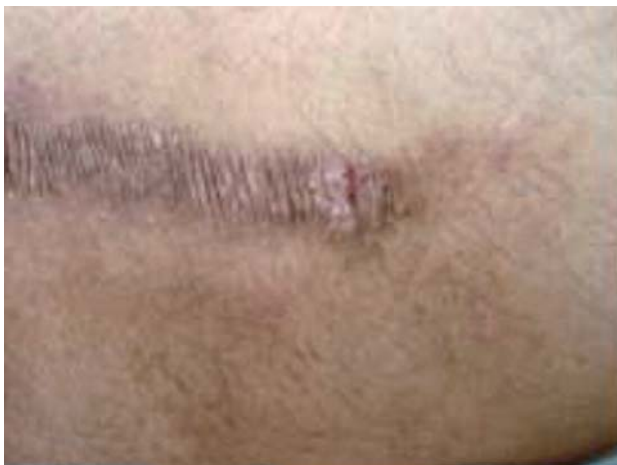
Fotografía 1. Placa liquenificada con trayecto lineal e hiperpigmentada en dorso.

Al examen clínico se observaron lesiones papulares escamosas y eritematosas formando placas, lesiones liquenificadas y lesiones cicatrizales, en su mayoría lineales con zonas hiperpigmentadas, firmes a la palpación y localizadas en espalda ( Fotografías 1 y 2 ), brazos y piernas ( Fotografía 3 ).