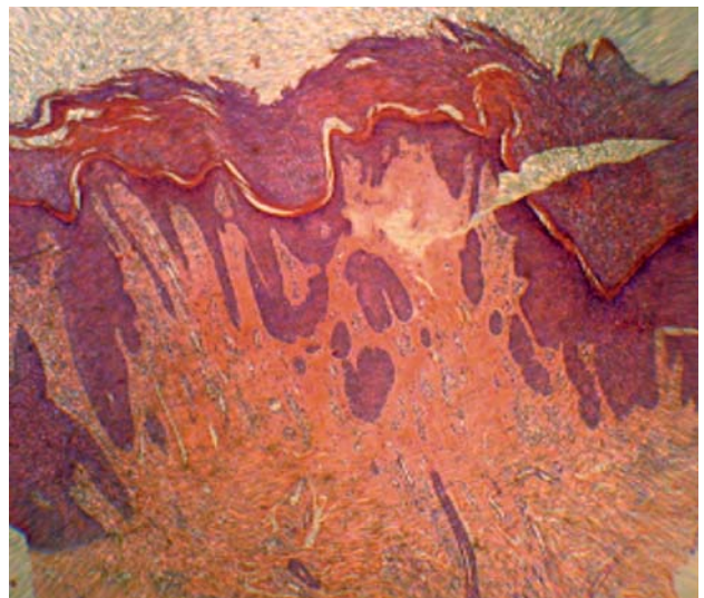
Fotografía 4. Hiperplasia psoriasiforme con marcada hiperqueratosis y leve infiltrado perivascular. HE 4X.