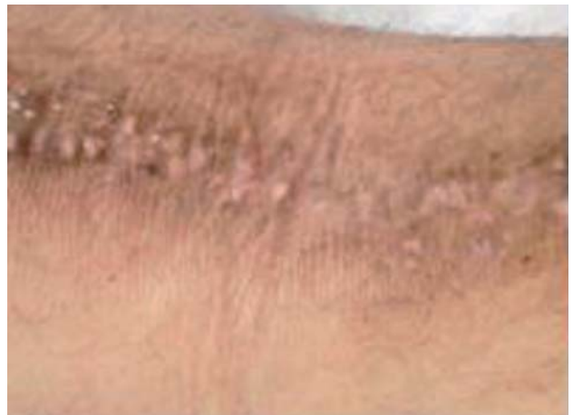
Fotografía 3. Lesiones papulares con liquenificación y trayecto lineal en fosa poplitea.