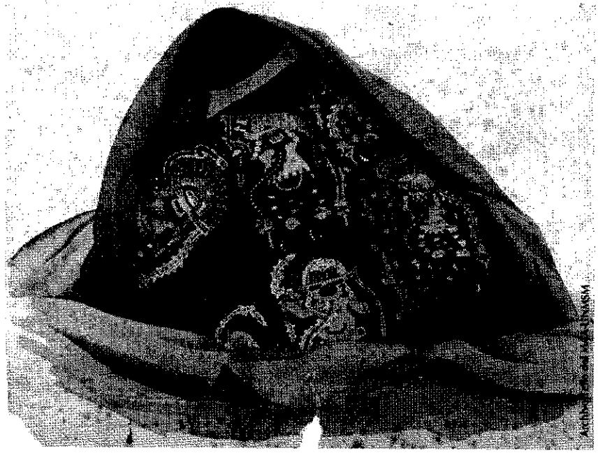
Acuarela del fardo funerario n.º 451, necrópolis de Wari Kayan, Paracas.