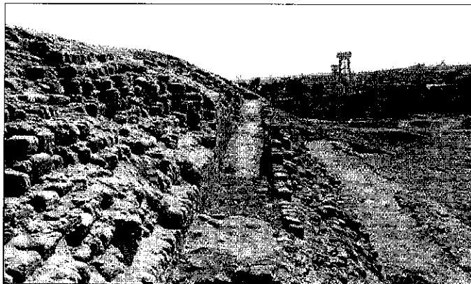
Vista desde el Este, del muro norte de la plataforma 2. Huaca San Marcos.

zados y un intermediario entre productores y consumidores" (Lumbreras, 1981: 170). Un asentamiento urbano se define entonces "(...) a partir del carácter especializado de los edificios, en donde la vivienda, desde la simple hasta la palaciega, es un apéndice de los edificios de función especializada" (ibid: 173).