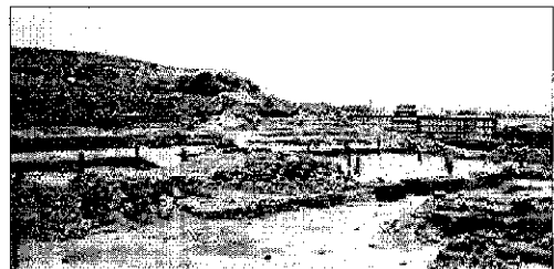
Vista de la Huaca San Marcos en la década de los 60, donde se aprecian los trabajos de excavación arqueológica en la "Plataforma Central".

El primer problema se refiere a la aparición de los grandes asentamientos urbanos en nuestro valle. En términos científico-sociales, un asentamiento urbano se puede entender de acuerdo al tipo de actividades que realizan sus habitantes en él. Así, el poblador urbano (...) es un productor de servicios (religiosos, técnicos, políticos, municipales, etc.), un productor de artefactos especiali-