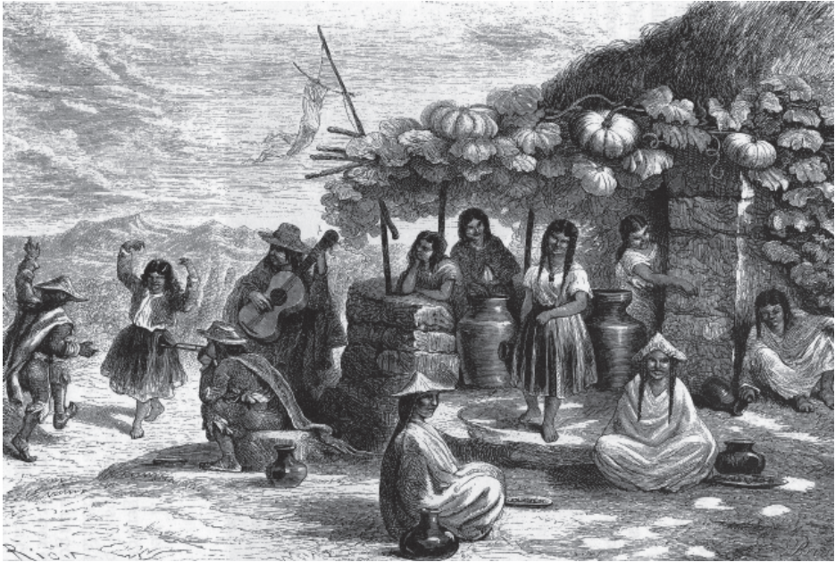
Fig. 1. Dibujo de 1840, del viajero francés Paul Marcoy, quien visitó Arequipa y describió las costumbres y tradiciones de la población arequipeña. (Marcoy, 2001: 80).

cocción. Estas técnicas se van aprendiendo en casa y son transmitidas de generación en generación. En segundo lugar, por el uso y mezcla de ingredientes, con productos de la zona y condimentos totalmente naturales, libres de saborizantes químico-industriales. La comida arequipeña no usa Sibarita, ni Ají-No-Moto, ni «otros» sobrecitos con saborizantes industriales. Tercero, el carácter familiar y social que forma parte y ha fomentado la comida arequipeña. Durante los almuerzos y comidas fluye la fraternidad, el calor maternal y familiar, de manera que cuando se extraña la comida, también se está extrañando a la madre, la familia. El cuarto, se refiere a la fuerza de la costumbre de respetar la dieta preparada para cada día de la semana y el establecimiento de horarios. De alguna manera se extrañará el lunes el chaque, el domingo el sabor agradable del adobo, y así sucesivamente la variedad de platos que se preparan para cada día de la semana. Aunque pareciera que por la fuerza de la costumbre se adquiere como mecanicidad o monotonía culinaria, el ser humano instintivamente se rige por la costumbre y los hábitos del grupo al que pertenece.