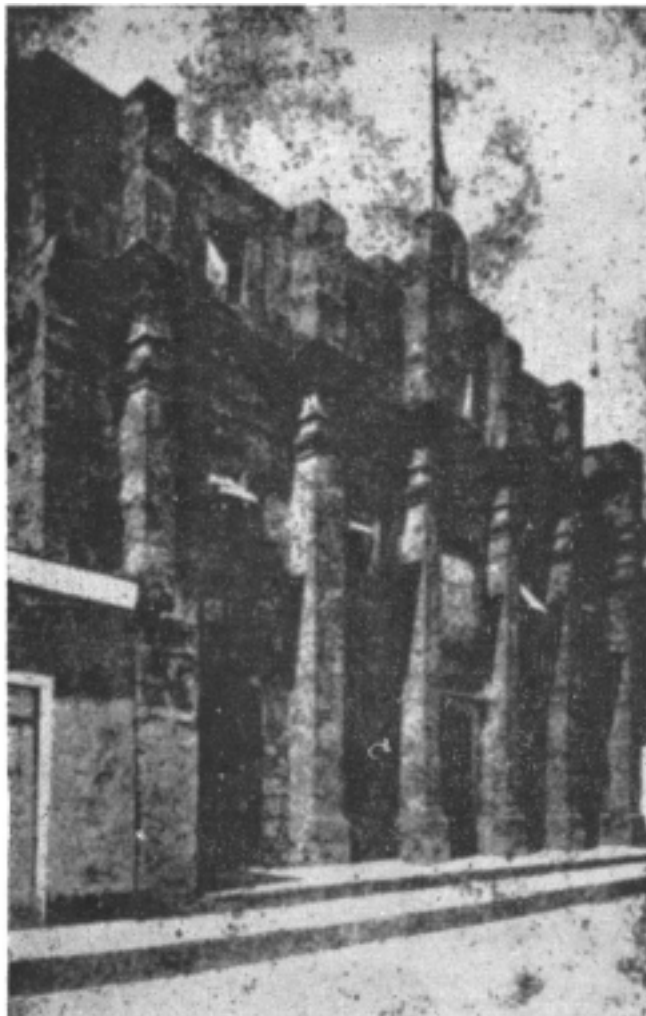
Edificio de la Ciudad de Santo Domingo que fue Iglesia de los Regulares de la Compañía de Jesús, en que celebraba sus actos eleccionarios y académicos desde 1748 hasta 1766 la Universidad Real y Pontificia de Santiago de la Paz y de Gorjón.