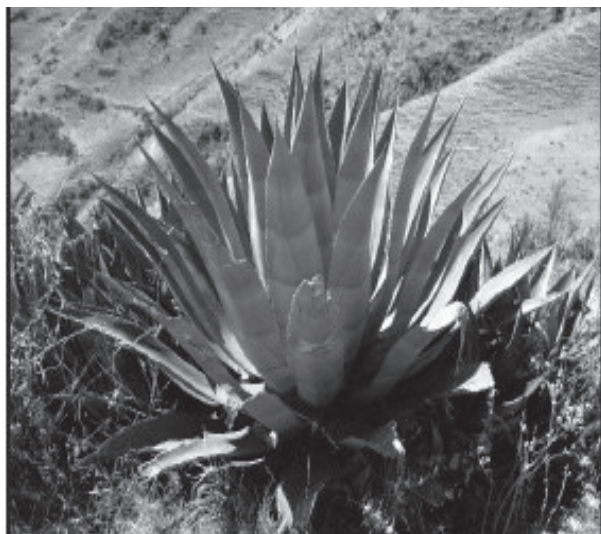
Figura 1. Cabuya azul de Huancavelica