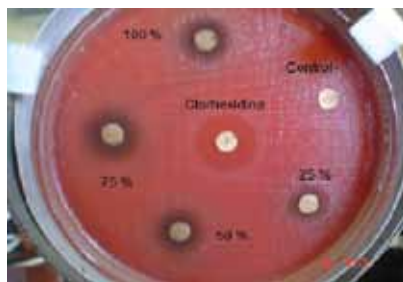
Fig 2. P. anaerobius . Extracto alcohólico de té verde.