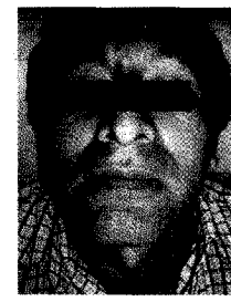
Fig. 3. Imágenes nueve días Post tratamiento.