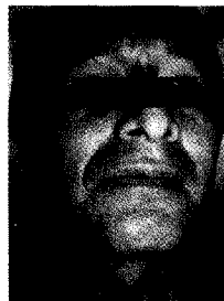
Fig. 1. Imágenes antes del tratamiento.

Luego de 9 días de tratamiento se realizó un control final, comprobándose la ausencia absoluta de signos y síntomas de infección e inflamación (Fig. 3), por lo que el paciente fue dado de alta sin prescripción adicional.