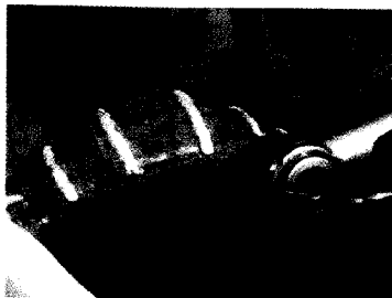
Fig 5. Colocación de guía quirúrgica y preparación de lecho óseo a través de ella con la fresa de 2mm. de diámetro