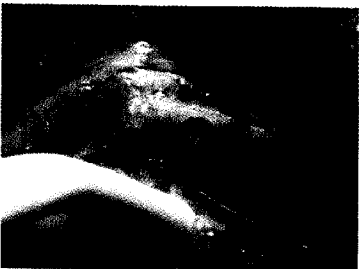
Fig 4. Decolaje: se observa el reborde alveolar