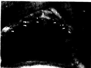
Fig 8. Colocación de los pines de paralelismo en los lechos óseos de 2 mm de diámetro