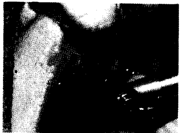
Fig 6. Preparación del lecho óseo con la fresa de 3.5 mm de diámetro