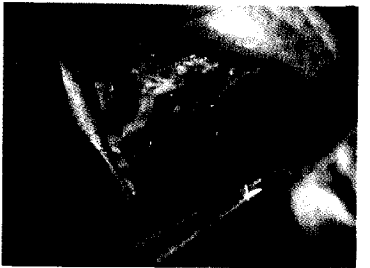
Fig 9. Colocación de los implantes dentales Replace Tapered (Nobelbiocare) con llave de torque (a 35 N fuerza) lo que permite la carga inmediata.