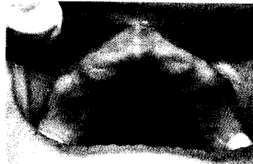
Fig 2. Foto preoperatorio