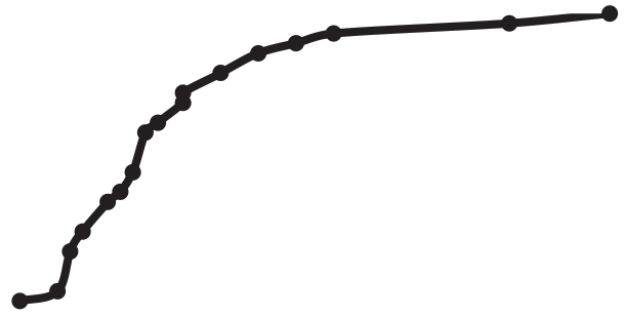
Figura 2. Tiempo de publicación de los resúmenes presentados al Congreso Peruano de Gastroenterología, 1998-2008.

objetivo, medición, intervención ni diseño) o revista donde fue publicado ( p > 0,05 ; Kruskal Wallis o U de Mann Withney según correspondía). No se encontró correlación entre el tiempo de publicación y el número de autores ( Rho = 0,33 ; p = 0,06 ) o el número de población incluida en el estudio ( Rho = 0,08 , p = 0,64 ). Tampoco se encontró asociación con la concordancia del primer autor, orden de los autores, total de autores o con los resultados y objetivos.