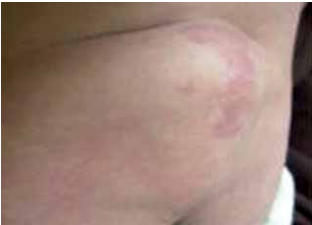
Fotografía 1. Tumoración de consistencia blanda sobre macula rojiza en región lumbosacra.

Al examen físico hallamos tumoración no dolorosa de 8x5cm de diámetro, de consistencia blanda, sobre macula rojiza (en vino de oporto) en región lumbosacra (Fotografías 1 y 2); había además movilidad de las cuatro extremidades sin alteración aparente.