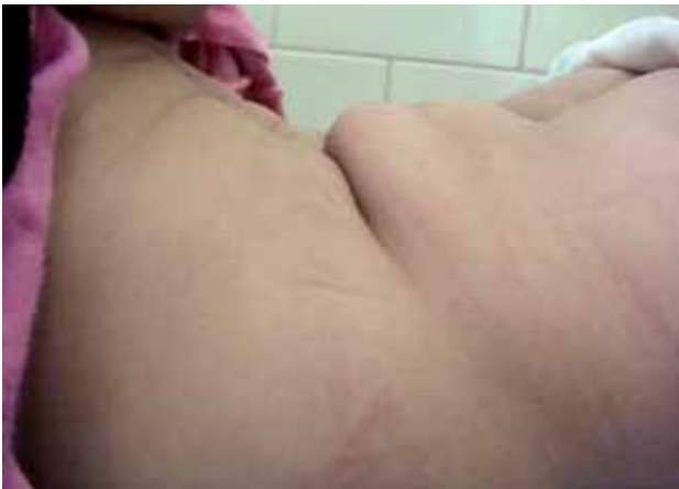
Fotografía 2. Vista lateral de tumoración lumbosacra en la que se evidencia repliegue producido por la tumoración.

Se realizaron exámenes de ayuda diagnóstica como ecografía de partes blandas en la que se sugirió descartar lipoma lumbosacro. Al no poderse evidenciar bien las lesiones en la ecografía de partes blandas se realizó una resonancia magnética que mostró discreta disrafia espinal oculta a nivel de L4, asociada a lipoma intrarraquídeo y a fino trayecto de aspecto fibroso que no llegaba a piel (Fotografías 3 y 4). La paciente fue referida a neurocirugía pediátrica para el manejo correspondiente.