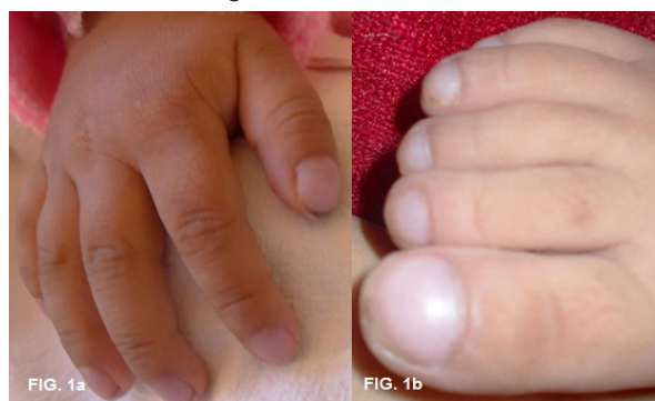
Figura N°01. Se observa la presencia de los dedos en palillo de tambor a nivel de las a) manos y b) pies, además de la cianosis a nivel ungueal.

Presenta una frecuencia cardiaca de 142 latidos por minuto, una frecuencia respiratoria de 42 respiraciones por minuto y una saturación sin oxígeno de 60%. No se observa ingurgitación yugular, con pulso carotídeo de intensidad adecuada. Al examen cardiovascular se palpa choque de punta a la altura del quinto espacio intercostal derecho, además se ausculta soplo holosistólico III/VI. Al examen vascular se aprecia pulsos adecuados en frecuencia, ritmo e intensidad, evaluados en región pedia y radial. El examen de extremidades da a conocer el tono, trofismo y movilidad conservada.