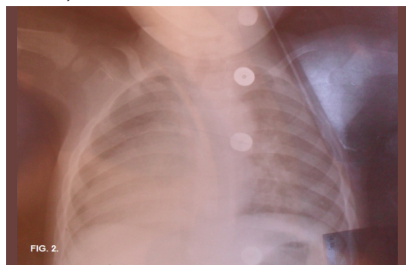
Figura N°02. Radiografía de tórax que muestra el desplazamiento del eje del corazón hacia el lado derecho del tórax, evidenciando la dextrocardia.

Se siguió el siguiente plan de trabajo farmacológico ceftriaxona 250mg c/12hrs por vía endovenosa, furosemida 5mg; captopril 5mg c/12hrs. El resultado del electrocardiograma muestra en DI una onda P positiva, un complejo QRS invertido y una onda T negativa (Fig. 3A), en aVR una onda P negativa, un complejo QRS positivo al igual que la onda T (Fig. 3B).