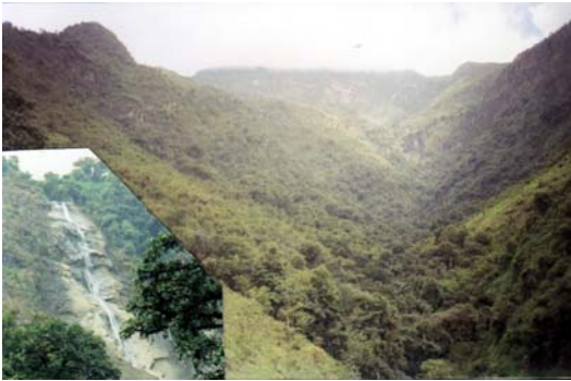
Figura 2. Vista panorámica del bosque de La Oscurana, parte inferior izquierda detalle de la catarata «El Chivo».

familia. Esta relación proporcional concuerda con otros inventarios realizados en las vertientes occidentales (Sagástegui & Dillon, 1991; Cano & Valencia, 1992; Dillon, 1993; Sagástegui, 1995; Sagástegui et al., 1995; Dillon et al., 2002).