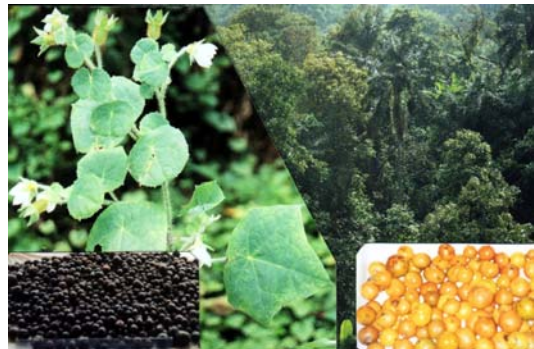
Figura 3. Detalle de la estructura del bosque. Izquierda: Especie endémica Nasa insignis (Loasaceae). Inferior izquierda: frutos (Myrtaceae). Inferior derecha: Frutos (Sapotaceae).

Las hierbas y arbustos son las predominantes; esta aseveración siempre ha sido considerada en otros tipos de bosques tropicales (Gentry, 1988). Sin embargo, los árboles son la forma de vida más notoria del bosque y en los cuales se han centrado la mayoría de estudios en bosques tropicales (e.g. Gentry, 1992; León et al., 1992). Existen aún en este bosque relicto especies arbóreas pioneras típicas [e.g. Nectandra laurel Nees, Persea sp. 1, 2 (Lauraceae), Cedrela montana Moritz. Ex Turcz. y Guarea kunthiana A. Juss. (Meliaceae)], así como trepadoras/lianas [e.g. Neomortonia nummularia (Hanst.) Wiehler (Gesneriaceae), Passiflora spp. (Passifloraceae)]. Las epífitas [e.g. Orchidaceae, Bromeliaceae, varias Pteridophyta, musgos] presentan un bajo porcentaje, probablemente por la carencia de colecciones, en comparación con estudios en bosques similares, los cuales indican un elevado número juntamente con hierbas y arbustos (Gentry, 1988).