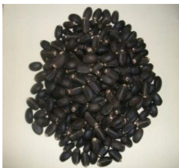
FIGURA 2. Semilla de Jatropha curcas L.

Los efectos biológicos reconocidos de la semilla de Jatropha curcas L. son respaldados por sus metabolitos secundarios, a la actualidad se conoce que presenta alcaloides, flavonoides, esteroides, lectinas, entre otros 9 .