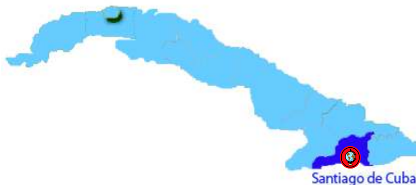
Figura 1. Ecosistema San Juan (●) en Santiago de Cuba-Cuba.

El ecosistema San Juan, ubicado en la ciudad de Santiago de Cuba-Cuba, recorre una longitud aproximada de 23.0 Km 2 (figura 1), donde a su río principal son descargados diversos efluentes con cargas contaminantes de naturaleza orgánica como inorgánica, encontrándose dentro de esta última determinadas concentraciones de metales pesados. Las aguas de este ecosistema, representan de gran importancia para la ciudad, ya que en esta cuenca hidrográfica del mismo nombre, existen identificados un gran número de pozos que son utilizados para el abastecimiento potable a la población humana. La evaluación de parámetros físico-químicos, metales pesados y análisis del costo ambiental sostenible relativo sobre el ecosistema San Juan se realizó en el periodo de lluvia comprendido entre mayo a noviembre del 2015.