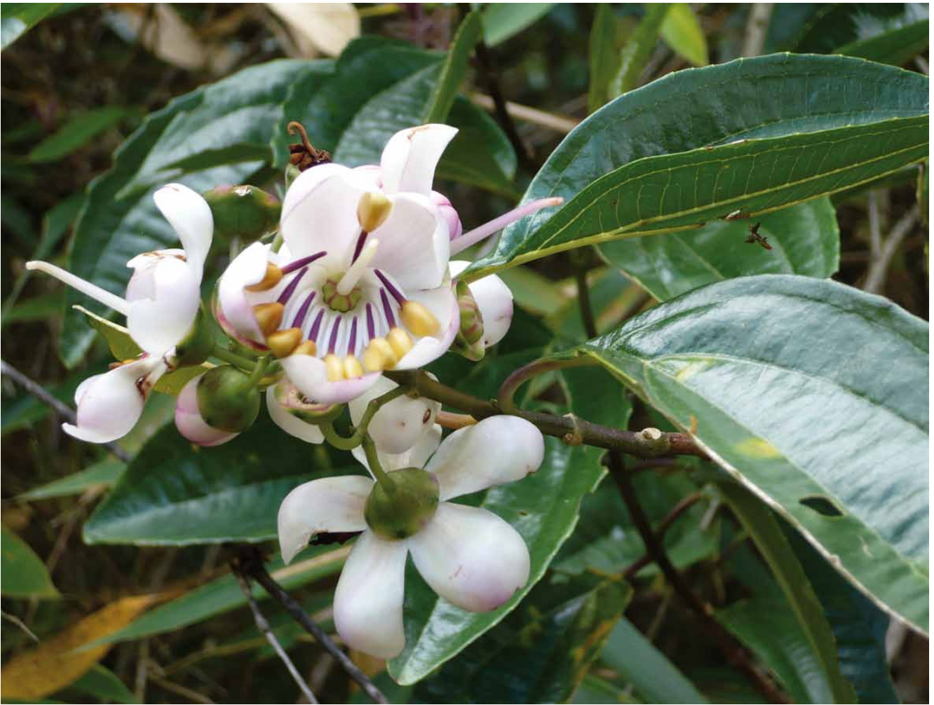
Figura 2. Axinaea wurdackii Sagást., S. J. Arroyo & E. Rodr. sp.nov. Rama florífera [(fotografía de la colección E. Rodríguez R. & S. Arroyo A. 3131 (HUT)].