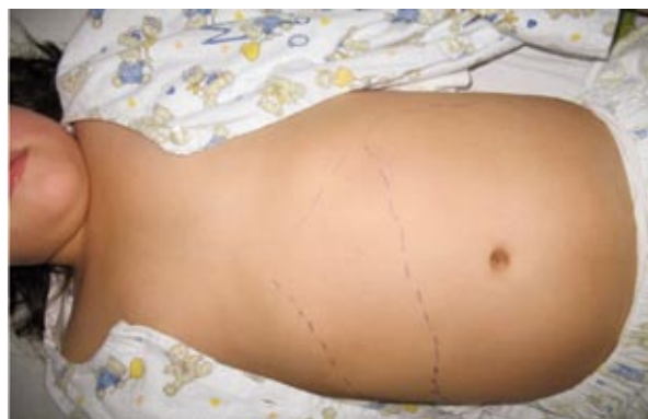
Figura 1. Nótese la hepato-esplenomegalia del caso índice.

Ante la sospecha de malaria se le realiza gota gruesa y frotis de sangre periférica detectándose abundantes formas trypomastigotes de T. cruzi (Figura 2), lo que fue confirmado por el Laboratorio de Leishmaniosis y Chagas del Instituto Nacional de Salud. La evaluación