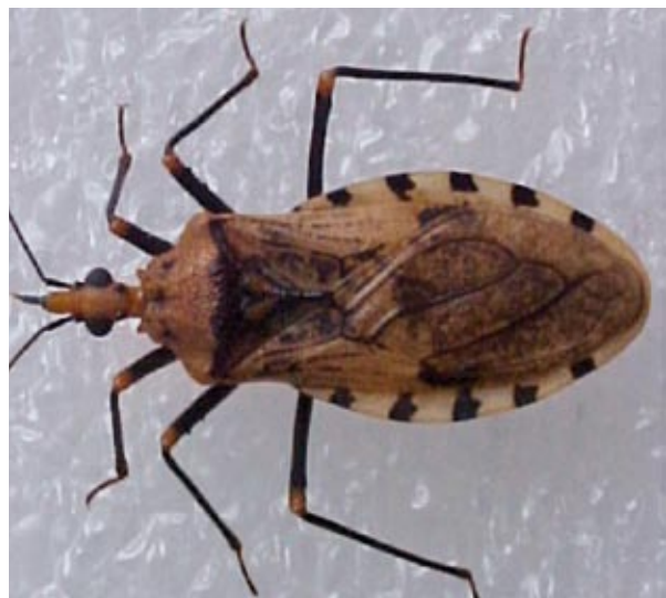
Figura 3. Vista dorsal de un espécimen macho de Panstrongylus geniculatus capturado en la vivienda del caso índice (aprox. 4x).

Todos los triatominos capturados fueron identificados como Panstrongylus geniculatus (Figura 3), de acuerdo con las claves dicotómicas donde esta especie está incluida 11,12 . En el examen microscópico del contenido digestivo, dos de los 11 especímenes colectados presentaron formas trypomastigotes metacíclicas de Trypanosoma , uno de ellos procedente de la vivienda del caso índice. Estas cepas han sido aisladas para su posterior caracterización genética.