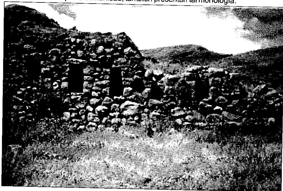
Foto 2: Sección del muro este del cuadrángulo de los nichos conservando algunos completos y otros desplomados.