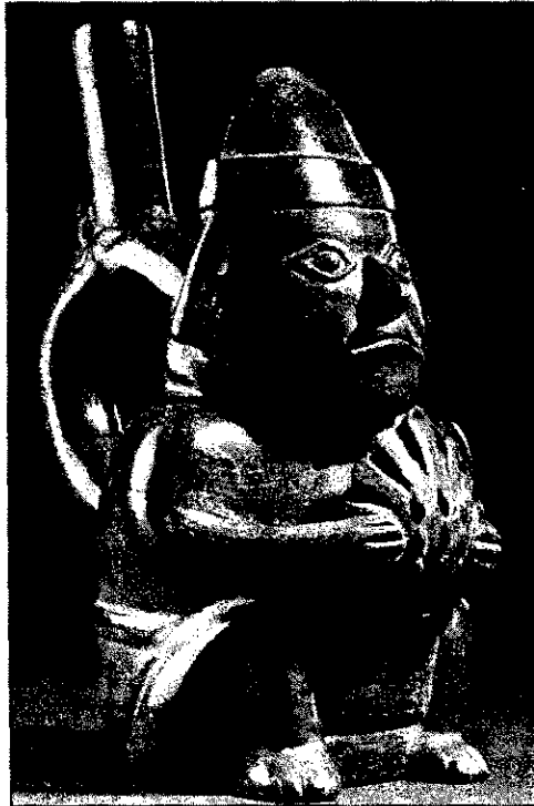
Figura 5. Ceramio Chimú, con representación de un personaje que sostiene una valva de Spondylus sp.

la presencia de spondylus (véase Tabla 1 ). En cambio, en yacimientos arqueológicos de la costa sur se ha registrado escasa presencia de este molusco tropical.