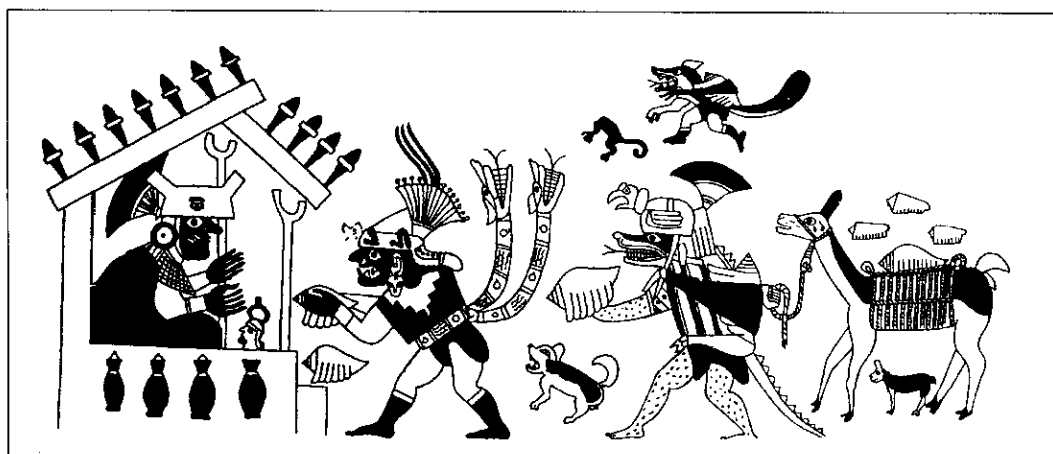
Figura 4. Representación de un señor Moche recibiendo como ofrenda las conchas de los moluscos Strombus galeatus y Conus fergusonii .

En los sitios arqueológicos de Lauri, Pasamayo y Puerto Chancay (valle de Chancay), se han identificado en superficie fragmentos de Spondylus princeps (Vidal, 1969; Horheimer, 1963). Hay un mayor número de sitios en los valles del Rímac y Lurín con