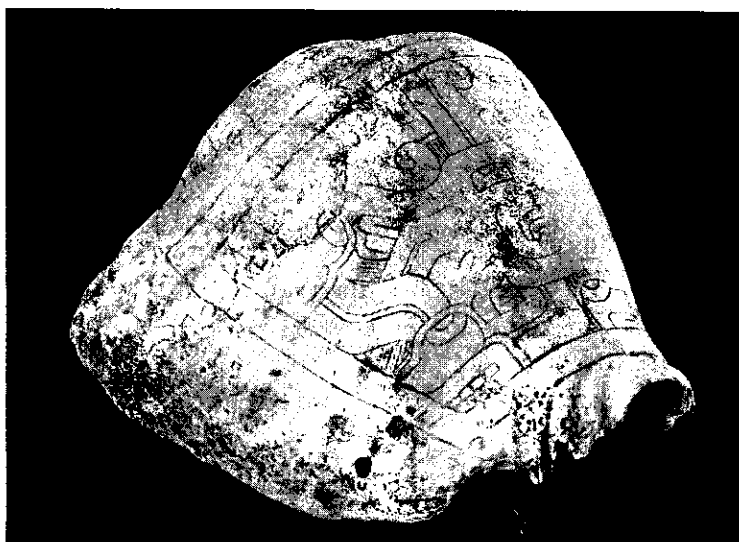
Figura 6. Caracol marino de la especie Strombus galeatus con decoración incisa. Presenta perforación circular en el extremo inferior del labio, próximo a la «boca» (estoma) del caracol. Fue recuperado en las excavaciones de una tumba del sitio de Kunturwasi.

En las excavaciones realizadas en el sitio arqueológico de Armatambo (Díaz, com. pers. ), se ha podido identificar tres ejemplares de Conus fergusonii , ubicados en el relleno que cubría una tumba disturbada.