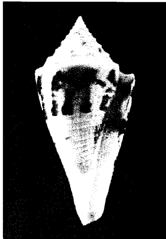
Figura 2. Gasterópodo de la familia Strombidae, conocido como «Cono». Todas las especies de este género son tropicales. Una de sus características más importantes es su colorido.