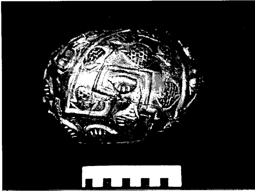
Figura 3. Ceramio Chavín, proveniente de la Galería de las Ofrendas del Templo Viejo. Presenta conchas de mullu y pututo, modeladas en relieve (Colección MAA-UNMSM).