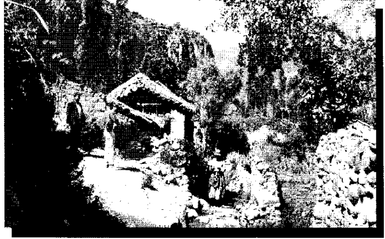
«Lo que nos urge es el reexamen y la reinterpretación de nuestro pasado socioeconómico, sociocultural y sociopolítico».

Finalmente, para que la Antropología cumpla con su papel, debe replantearse, en profundidad, su compromiso con el mundo del desarrollo. Debe identificar aquellos casos en que se manifiesta la diferencia de un