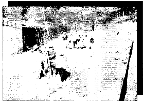
«La aplicación del desarrollo entraña la implementación de un proyecto».

bienestar y la libertad del ser humano en la sociedad en la que vive. La antropología, que es la ciencia del hombre por excelencia, es la que con mayor obligación debería establecer la verdad, a partir de sus resultados científicos. Muchas razones militan en favor que sea la antropología la disciplina más indicada para esta tarea. Desde la perspectiva antropológica, todos los pueblos y culturas revisten el mismo interés, como objeto de estudio. Por ello, la antropología se opone al punto de vista de los que creen ser los únicos representantes del género humano, estar en el pináculo del progreso o haber sido elegidos por algún dios o la historia para moldear el mundo a su imagen y semejanza.