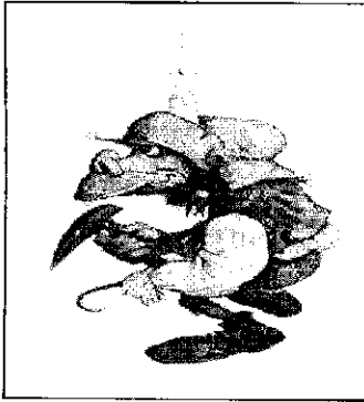
Kühnelt, duende escandinavo