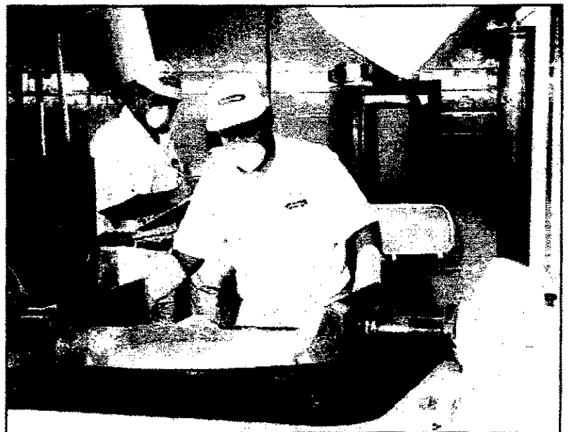
Existe una cultura específica por cada empresa que aparece en el mundo

Si bien el concepto de "cultura organizacional" pretende abstraer una realidad mucho más específica, presenta los mismos problemas que el concepto antropológico de "cultura", pues no existe una definición unánimemente aceptada. Debido a esto, existen innumerables definiciones para "cultura organizacional", por ejemplo para Carmen Cecilia Rivera «cultura organizacional es un conjunto de valores implícitos que ayudan a las personas en la organización a entender cuáles acciones son consideradas aceptables y cuales son considerados inaceptables. A menudo esos valores son comunicados a través de significados simbólicos»(1994:38).