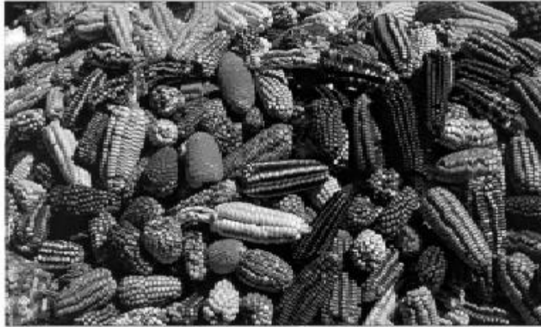
Fig.9.- El alimento sagrado del maíz.