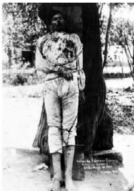
Fig. 12.- Anónima, Cabecilla Filomeno Osorio «murió fusilado el 24 de mayo de 1929 en Victoria, Gto.». LA VIDA AIRADA 1989: 57.