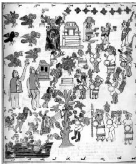
Fig. 2.- La fiesta mexicana del Atamalqualiztli . Primeros Memoriales (SAHAGÚN 1948: 319).

Xochiquetzal , en actividad de tejedora. El Tamoanchan era uno de los mundos del más allá vinculado a la lluvia, la neblina, las flores, la fertilidad y el origen del maíz. Se insinúan ritos de petición de lluvias dirigidos a los tlaloques, los dioses del agua. Delante