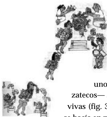
Fig. 3.- Detalle del Atamalqualiztli : danza de los mazatecos tragándose unas serpientes vivas. Primeros Memoriales (SAHAGÚN 1948: 319).

de un cerro con una cueva, santuario de Tlaloc , se efectúa un ritual espectacular en el que unos hombres —llamados mazatecos— se tragan unas serpientes vivas (fig. 3). Este rito, al parecer, se hacía en petición de lluvias. A estas ceremonias asisten como espectadores una multitud de dioses identificados por sus insignias (fig. 4). Su presencia en el Tamoanchan , finalmente, se vinculaba con la concurrencia de las almas de los muertos que en el código se representan por aves de plumas preciosas, 3 búhos y lechuzas (fig. 5).