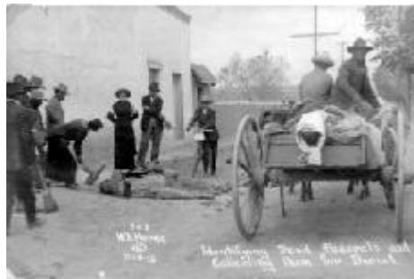
Fig. 9.- Walter H. Horne, Triple execution in Mexico , 1916. Artes de México , revista libro n.º 48, 1999, p. 36.

Cada vez son menos los testigos que quedan de aquella barbarie vista en las décadas de los '20 y los '30, pero todos coinciden en que se llegó a usar la táctica de la exhibición pública de los cadáveres que dejaban ambos bandos, especialmente los llamados cristeros. Se dejaban, pues, los cuerpos expuestos durante días en las plazas. También de los caídos en las filas del gobierno se hacía exhibición, pero ésta era para mostrar el dolor que dejaban sembrado los rebeldes; en todo caso, como homenaje público.