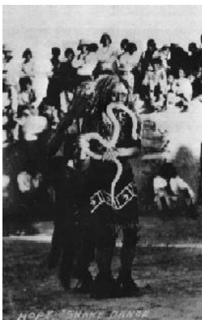
Fig. 8.- La Danza hopi de las Serpientes. Oraibi, Arizona, 1889 (según FEWKES 1986: 315).

las Serpientes de los hopis de Walpi y Oraibi fue a fines del siglo XIX un evento espectacular que fue comentado por numerosos antropólogos (fig. 8). Sin embargo, falta profundizar en la interpretación de este extraño ritual. La relación con las almas de los muertos que hemos mostrado en el caso del Atamalqualiztli mexica, no es aparente en esta ceremonia hopi. Sin embargo, en ambos casos se establece un vínculo entre la manipulación de las serpientes y el culto al agua. Las serpientes son consideradas los guardianes de los manantiales y se les rinde culto para