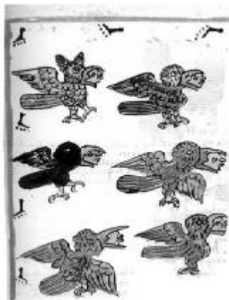
Fig. 5.- Detalle del Atamalqualiztli : las almas de los muertos representadas como pájaros de pluma preciosa, como búhos y lechuzas. Primeros Memoriales (SAHAGÚN 1948: 319).