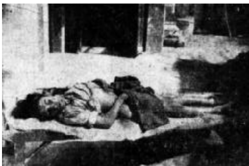
Fig. 5.- Anónima, niña de 11 años de edad violada y estrangulada. Sol de León , 24 de febrero de 1949. Hemeroteca del Sol del Bajío, Celaya, Gto.

En el último de los casos, fotografías crudas. Imágenes que, libres de pudor, muestran cadáveres sangrantes, cuerpos mutilados, destrozos materiales resultado del infausto evento que segó vidas (figs. 5-7). Personas que fueron muertas víctimas de la