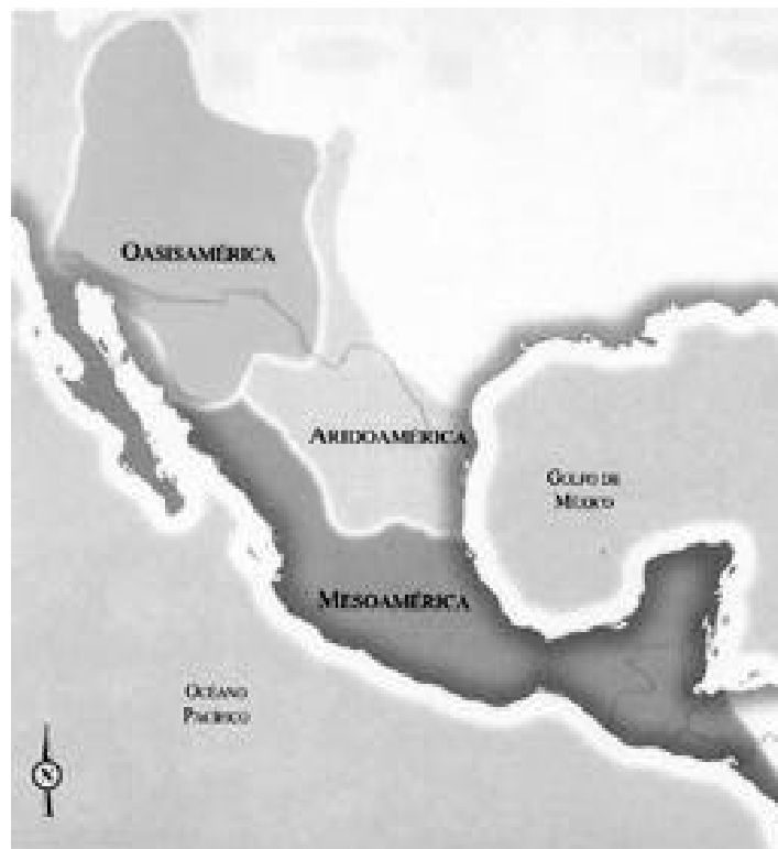
Fig. 1.- Mesoamérica, Aridoamérica y Oasisamérica (según Arqueología Mexicana , n.º Especial n.º 5, 2000).

En esta ponencia analizaremos un ejemplo del ritual mexicana de la fiesta del Atamalqualiztli o de «la renovación del maíz», que se celebraba en la capital Tenochtitlán en la última época antes de la conquista española; presentaremos una novedosa interpretación de algunos aspectos de esta fiesta. La comparación con datos etnográficos recientes de los nahuas de Guerrero y de la Huasteca veracruzana nos ayudará a ver más claramente el estrecho vínculo que se establece aún hoy día entre los muertos, las nubes, la lluvia y el maíz. Este último vínculo se ve aún más claramente al presentar datos comparativos de los indios pueblo de Norteamérica acerca de estos mismos temas (fig. 1).