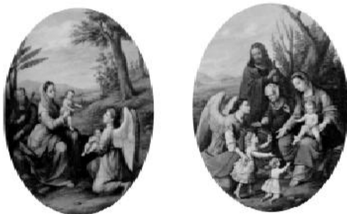
Fig. 2.- Francisco Morales, Niños Velasco , 1870 ARMELLA, Virginia 1970: 39.

Desde luego, el uso de la fotografía para realizar los retratos dependía de tener a la mano el recurso tecnológico. Así que las fotografías como documento que testimonia un fenómeno social, se nos presentan como una fuente limitada a la utilización de un recurso tecnológico. En Guanajuato 42 la fotografía llegó, como a tantos otros lugares, con fotógrafos viajeros desde mediados del siglo XIX. Pero con el tiempo se fueron estableciendo algunos estudios fotográficos en las principales ciudades del estado. 43