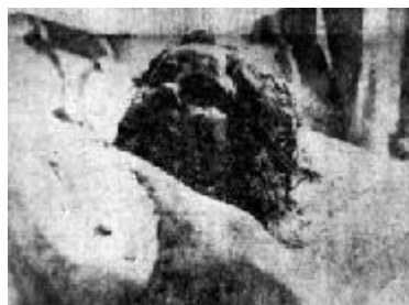
Fig. 6.- Blas Barajas, «El cadáver de la Sra. Eloisa García, víctima de la terrible explosión en el calvario». Sol de León , 15 de abril de 1950. Hemeroteca del Sol del Bajío, Celaya, Gto.

Las imágenes de los asesinados que yacen en las planchas de las instituciones policíacas, de los muertos que se encuentran aún