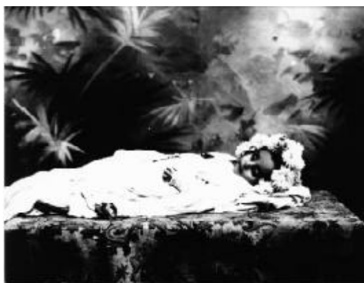
Fig. 4.- Romualdo García, s/t, principios del siglo xx. Artes de México , revista libro n.º 15, 1998, p. 51.

tendió a calificar a la tradición de los angelitos como un fenómeno exclusivamente observable entre la gente pobre (GARCÍA 1999).