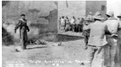
Fig. 8.- Walter H. Horne, Triple execution in Mexico , 1916. Artes de México , revista libro n.º 48, 1999, p. 35.

factores como la defensa de la libertad de culto, la lucha por la tenencia de la tierra y el fortalecimiento de grupos políticos emergentes. El resultado fueron feroces luchas en las que, como no se había visto en el estado desde el movimiento independentista, la muerte