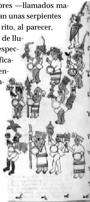
Fig. 4.- Detalle del Atamalqualiztli : «todos los dioses» asisten a la fiesta. Primeros Memoriales (SAHAGÚN 1948: 319).

de un cerro con una cueva, santuario de Tlaloc , se efectúa un ritual espectacular en el que unos hombres —llamados mazatecos— se tragan unas serpientes vivas (fig. 3). Este rito, al parecer, se hacía en petición de lluvias. A estas ceremonias asisten como espectadores una multitud de dioses identificados por sus insignias (fig. 4). Su presencia en el Tamoanchan , finalmente, se vinculaba con la concurrencia de las almas de los muertos que en el código se representan por aves de plumas preciosas, 3 búhos y lechuzas (fig. 5).