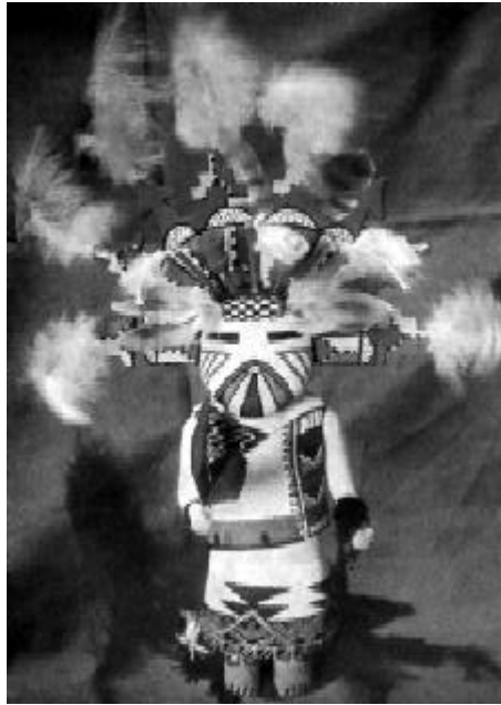
Fig. 6.- Kachina hopi en miniatura con tocado de nubes (tableta) « Butterfly Kachina Maiden » (Doncella Kachina Mariposa) (según COLTON 1959, fig. 6).