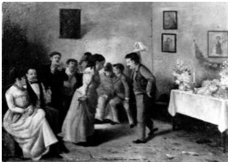
José Effio. El velorio . Lima, 190?

Sin embargo, la mencionada tercera pareja no es la principal, pues, con sutileza, se limita a enmarcar el fondo de la estancia donde un hombre abraza a una compungida mujer a la cual consuela; es, con seguridad, la madre de la criatura, quien trata de sobreponerse al dolor con el mayor recato posible, para no impor-