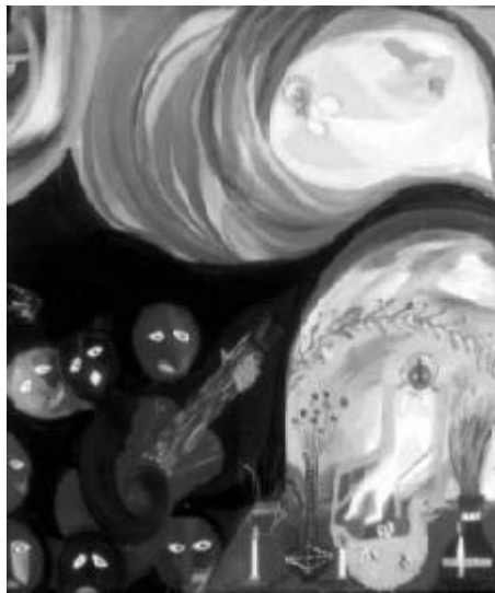
Violeta Parra. Muerte del angelito. Chile, 196?

Varias décadas pasarían para que la Muerte del angelito fuese nuevamente pintada, esta vez por la cantante chilena Violeta Parra, artista muy lejana al mundo académico quien, además, compone una canción sobre este asunto. Interesante cuadro resuelto a través de una composición plana dominada por espacios curvos donde Violeta inserta, en uno de ellos de gran luminosidad, al angelito sentado en una silla puesta sobre una mesa decorada con