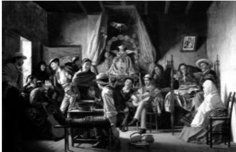
Manuel Antonio Caro. Velorio del angelito . Chile, 1873

cero calienta el ambiente, los demás actores se aglutinan en el segundo plano. A la izquierda, junto a la ventana que los ilumina, algunas personas conversan y beben, listas para rasgar la guitarra, momento aprovechado por una joven, quien mira con coquetería al único «pituco» vestido con terno y abrigo, atuendo que demarca su diferencia social frente a los demás. A media luz, a la derecha, acompañada de un hombre abstraído y de una mujer con una niña en los brazos, destaca la madre compungida sobre la cama donde, es probable, alumbrara a la criatura; sobre su cabeza el cuadro de la Virgen del Carmen (patrona de Chile) con el Niño en los brazos, alude, además del credo religioso, a un acto de solidaridad, pues ella también perdió a su Hijo.