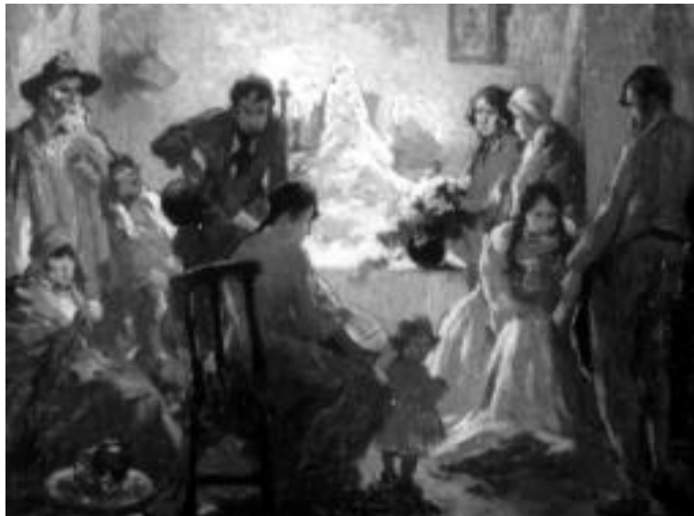
Arturo Gordon. El velorio . Chile, 191?

El asunto es tocado otra vez por Arturo Gordon, artista chileno de la llamada «Generación del 13», quien reivindica en su país, por segunda oportunidad, los temas populares. Con una pincelada ágil, el color es manejado a modo de emplaste, razón por la cual los detalles dejan de ser importantes al carecer de dibujo exquisito. El Velorio del angelito se desarrolla en el interior de una habitación dominada por medias tintas para el primer plano, donde están distribuidas las personas afectadas por el dolor expresado en sus actitudes. En el segundo plano, la luz intensa de las cuatro velas resalta, como una aparición, al angelito vestido de blanco