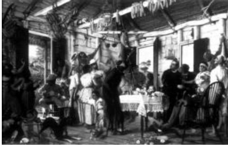
Francisco Oller. El velorio de angelitas . Puerto Rico, 1893

que cuelga de la pared. Por su posición respecto al «crucificado» nos recuerdan estos personajes al buen y al mal ladrón que acompañaron a Cristo en el Monte Calvario. Recordamos también que en el momento de la crucifixión los soldados se jugaron al pie de la cruz las vestimentas de Cristo con dados. Creemos que Oller también hace alusión a este episodio con la inclusión de las barajas españolas al pie del altar.