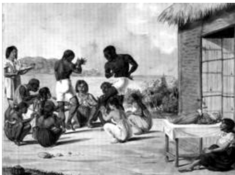
François Désiré Roulin. Orillas del Magdalena. El baile del angelito . Colombia, c 1823.

El primer testimonio pictórico es del médico y científico francés François Désiré Roulin en 1823. En Orillas del Magdalena. El baile del angelito , registra a un grupo de negros bailando acompañados de la quijada de burro, tambor, flauta y palmas batientes,