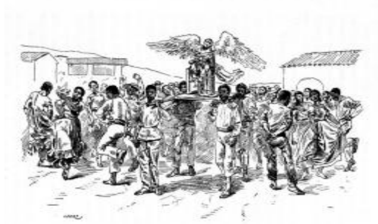
Charles Wiener. Funerales de un negrito en la mampuesteria cerca de Trujillo. Perú, 1876

Si bien el relato de Wiener está lleno de perplejas reflexiones, algunas de ellas despectivas hacia las costumbres locales, es un texto rico donde plasma, detalladamente, esta ceremonia inmersa en un contexto religioso-social. En su dibujo muestra el momento cuando el angelito es trasladado, acompañado de la zamacueca que bailan familiares y amigos. Rico testimonio iconográfico que entrega el autor gracias al cual rescata no sólo la tradición religiosa sino el baile, los vestidos, la arquitectura de un humilde pobla-