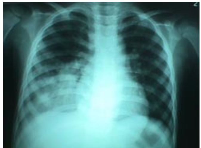
Fig. N° 2.- Radiografía tomada el día de su ingreso al HNGAI, se aprecia imagen de consolidación en la misma zona que la Figura 1.