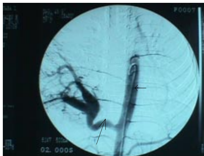
Fig. N° 5.- Arteriografía: Vaso anómalo de gran calibre (flecha grande) que nace de aorta torácica (flecha corta) e irriga el tejido pulmonar que correspondería al lóbulo inf. derecho.

Hace algunos años, ante la sospecha de secuestro pulmonar, el diagnóstico se realizaba post-cirugía con