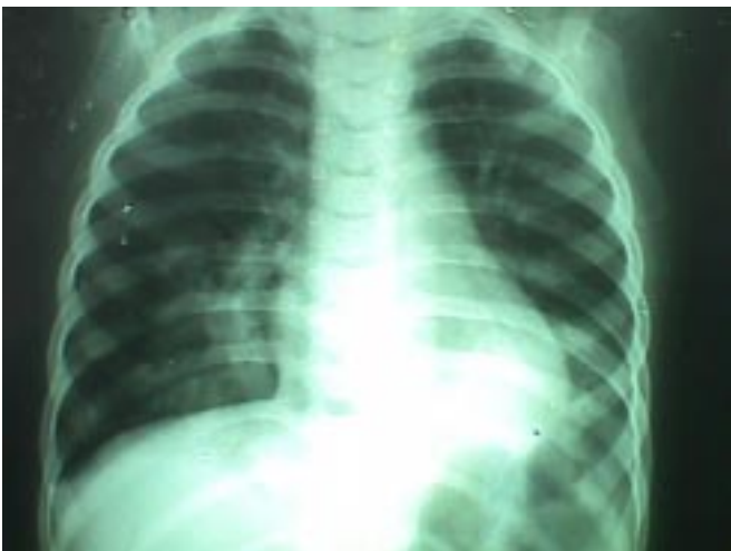
Fig. N° 1.- Radiografía tomada dos años atrás. Diagnóstico de alta: Bronconeumonía. Se apreciaba desde entonces imagen radiopaca (base de HTD) sugerente de consolidación y algunas imágenes quísticas.

pediátrica. En nuestro paciente, como dijimos anteriormente, se sospechó de una malformación debido a la comparación de imágenes radiográficas y a las infecciones respiratorias a repetición. Dentro de las malformaciones congénitas, por frecuencia deberíamos restringirnos hacia tres entidades principales: quiste broncogénico, malformación adenomatoidea quística y secuestro pulmonar. La malformación adenomatoidea quística y el quiste broncogénico son diagnosticados a edades más tempranas que el secuestro pulmonar (como en nuestro paciente), pero básicamente se manifiestan como síndrome de distress respiratorio en neonatos o a los pocos meses del nacimiento ( 1 ). La imagenología es parecida en las tres entidades, en el quiste broncogénico, se observa una lesión quística única de paredes bien definidas, en la malformación adenomatoidea quística la imagen radiográfica característica es una masa de tejido blando conteniendo múltiples áreas quísticas de varios tamaños, en tanto que el secuestro pulmonar muestra una masa sólida multiquística, más frecuentemente en un lóbulo pósteroinferior, como en nuestro paciente ( 1,6 ). La principal diferencia es que en las primeras dos entidades existe un crecimiento mayor del lóbulo afectado y por consiguiente hay desplazamiento de las estructuras torácicas adyacentes, lo cual no es evidente en nuestro paciente. La mayor certeza en el diagnóstico y lo que nos llevó a