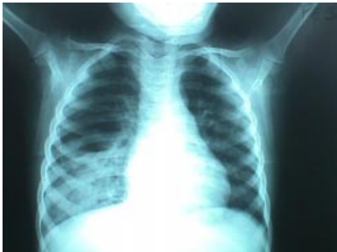
Fig. N° 3.- Radiografía aprox. un mes después de su ingreso, la imagen ha disminuído ligeramente de extensión, pero se evidencia nivel hidroaéreo no apreciado en radiografías anteriores ni en primera TAC.

la arteriografía fue la evidencia de un vaso anómalo en la TAC helicoidal con contraste (Fig. 4).