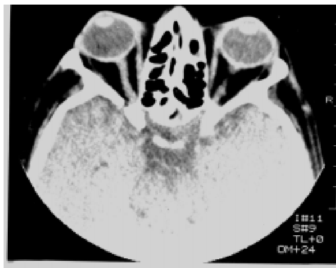
Foto Nº 2.- Se aprecia un engrosamiento de músculos rectos internos.

Confirmamos que la oftalmopatía tiene una distribución etárea similar a la totalidad de pacientes