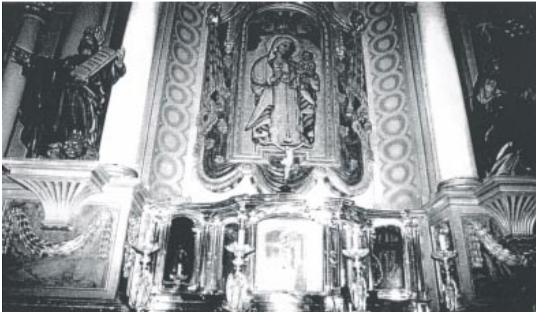
Virgen de la Antigua en la Catedral de Lima

excelentes pinturas de los misterios de la Virgen y lo que sale del Retablo otras pinturas en quadros dorados de la vida de Christo nuestro Señor todo con adorno y señorío. Tiene en medio una preciosa y grande lámpara de mas de ciento y setenta marcos de plata... 10 .