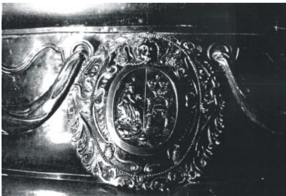
Escudo de la Universidad de San Marcos

los grados que confería la Universidad y su altar estaba al cuidado de los sanmarquinos 14 .