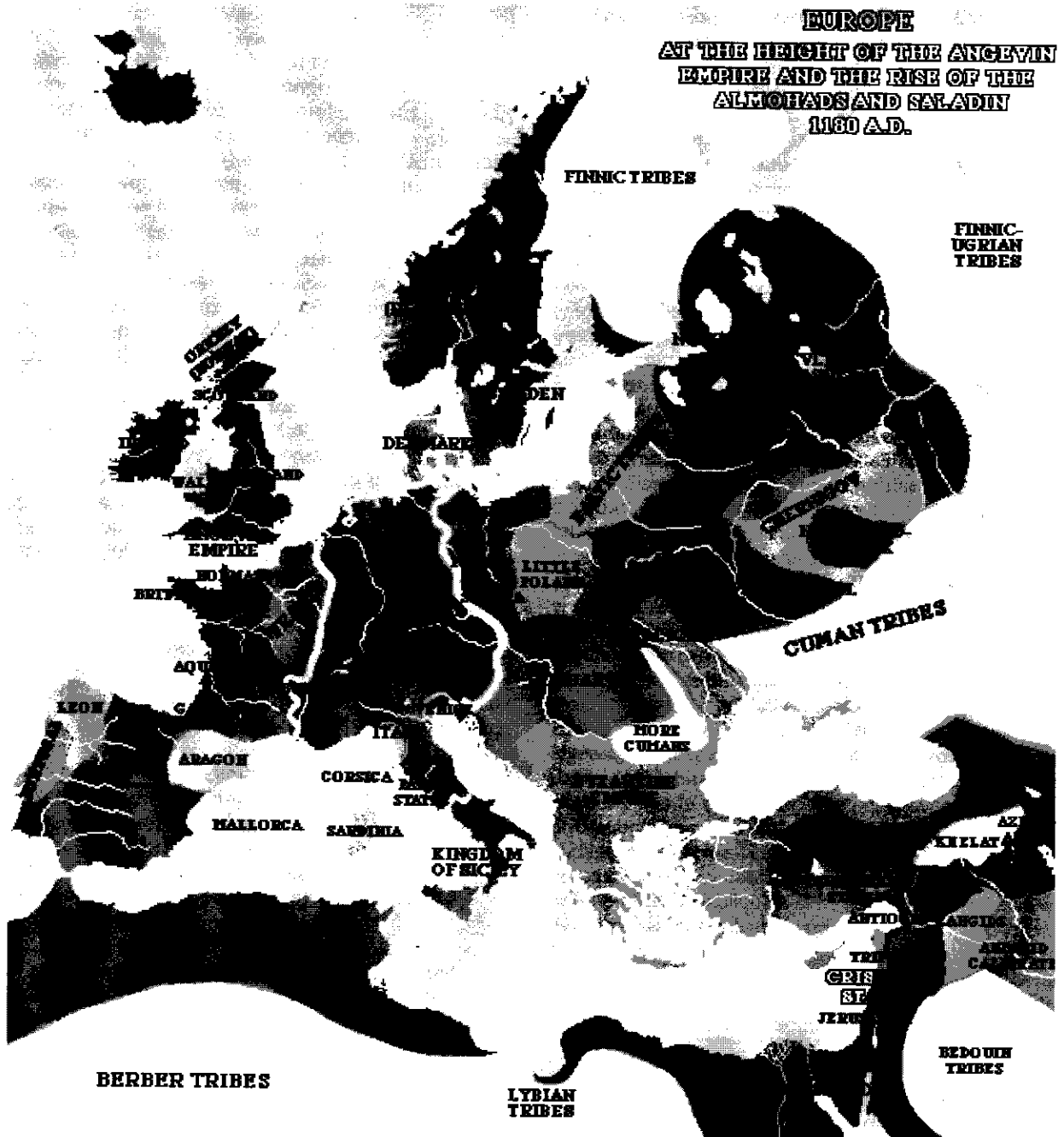
Mapa de Europa en la Edad Media