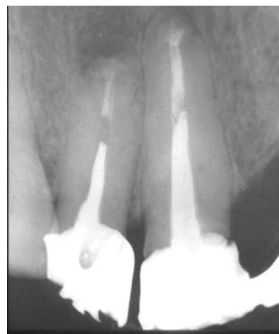
Fig. 2 postoperatorio inmediato