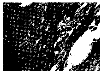
Fig.6: A los 14 días se observan en la parte central escotaduras de reabsorción conocidas como Lagunas de Howship que son zonas de reabsorción ósea, en esta fotografía no se ven los osteoclastos por que deben encontrarse en un plano mucho mas profundo.