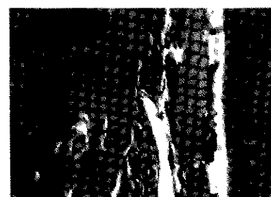
Fig. 8: Se observa en el centro del LPD la zona de Hialinización presentándose hueso amorfo sin células