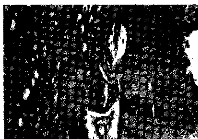
Fig. 2: A los 7 días observamos pérdida de células en la zona de compresión y hacia la izquierda la zona de tensión con células.