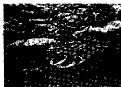
Fig.7: A los 14 días se observa en la zona de compresión osteoclastos y vasodilatación