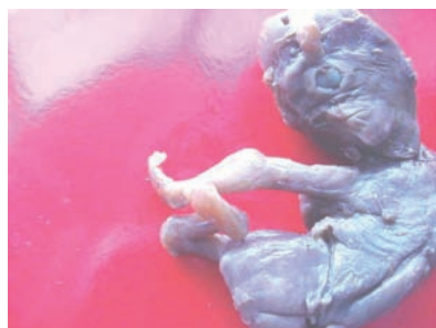
Figura 1. Holoprosencefalia. Trastorno caracterizado por la ausencia del desarrollo del prosencéfalo.

LBWC: limb body wall complex (complejo de defectos de pared abdominal y extremidades) MRKH: Mayer-Rokitansky-Kayser-Häuser