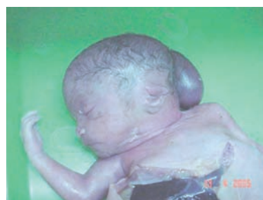
Figura 2. Síndrome de Meckel-Gruber: Encefalocele occipital y riñón poliquistico en un óbito fetal de 26 semanas.