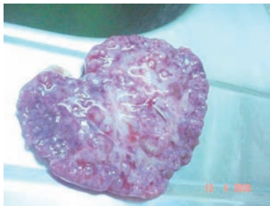
Figura 3. Síndrome de Meckel-Gruber: Hipoplasia pulmonar y fenotipo Potter secundario al oligohidramnios. Herencia autosómica recesiva, riesgo de recurrencia: 25%.