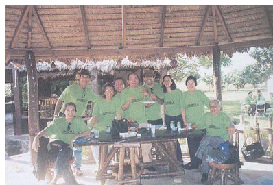
Grupo de dermatólogos, acompañados de representantes del Laboratorio Roemmers

Hubo 472 participantes ( 110 becados ) : Bolivia: 111,