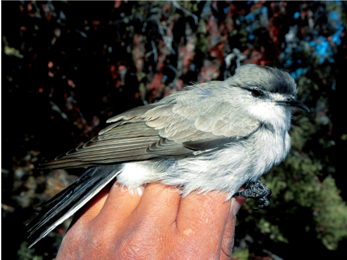
Figura 2. Muscisaxicola frontalis , nótese la coloración negra en la región frontal que se prolonga hasta la región pileal central (corona) y la región loreal de color blanco.

un porcentaje de osificación del cráneo del 25%. Una posterior revisión de la literatura y comparación con especímenes de las colecciones ornitológicas de los Museos de Historia Natural de la Universidad Nacional de San Agustín de Arequipa (MUSA) y de la Universidad Nacional Mayor de San Marcos (MUSM) nos permitieron confirmar que se trata de la especie M. frontalis . El espécimen (junto con el contenido estomacal y tejidos preservados) se encuentra depositado en la colección del MUSM (GSV 2010-85). Con este reporte extendemos el rango migratorio de distribución norte de la especie hasta Huancavelica y su rango altitudinal hasta los 4450 m para el Perú.