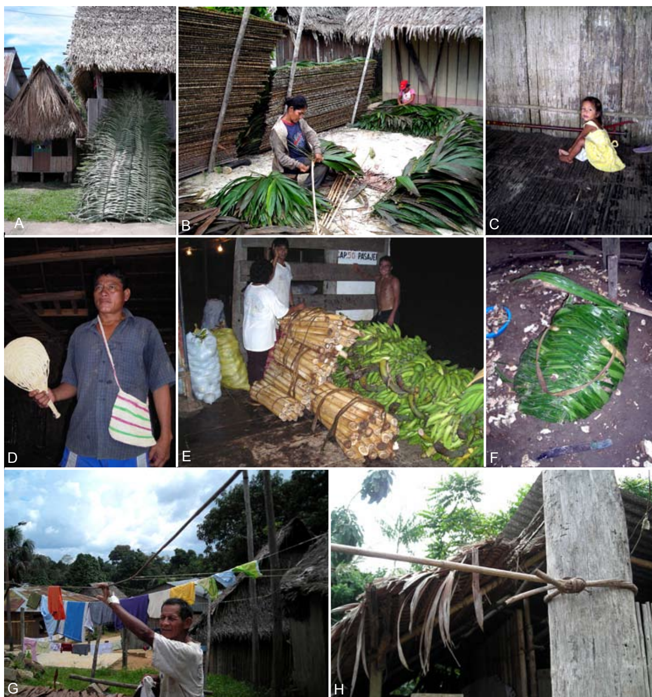
Figura 2. Usos de palmeras, en los alrededores de Iquitos, Amazonía Peruana. A. Techos de Mauritia flexuosa (vivienda pequeña lado izquierdo) y de Attalea phalerata (vivienda grande lado derecho), y cumbres aún no colocadas (hojas verdes de Attalea phalerata apoyadas). B. Hojas de Lepidocaryum tenue , tejidos para la construcción de los techos. C. Interior de vivienda rústica con pisos y paredes utilizando madera de Socratea exorrhiza . D. Abanico tejido de hojas de Astrocaryum chambira . E. Palmitos de Euterpe precatoria siendo transportado a los mercados en Iquitos. F. Canasto tejido de hojas de Aphandra natalia . G-H. Tallo de Desmoncus giganteus usado como cuerda.

la hepatitis, náusea y vómito. Construcción — Los troncos son utilizados para obtener tablas que son usadas en los pisos y las paredes de las viviendas, y como vigas en la construcción de techos; ocasionalmente también son usados como postes en la construcción de viviendas y cercos; las hojas son ocasionalmente utilizadas en el techado de viviendas temporales y viviendas chicas. Herramientas y utensilios — Ocasionalmente las raíces fúlreas cubiertas de espinas son utilizadas para rallar plátano o pelar yuca; las semillas se utilizan para collares. Alimenticio — Los frutos suelen ser utilizados para la elaboración de bebidas y se comen; las larvas de coleóptero que se desarrollan en los