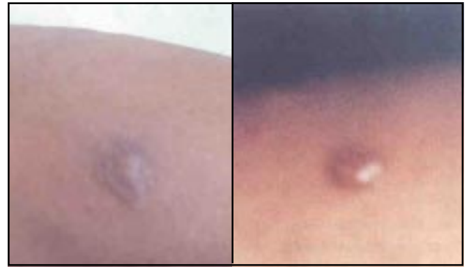
Fig. Nº 1.- Apariencia clínica de la angiomatosis bacilar cutánea ocasionada por Bartonella henselae (o B. quintana ) (derecha) y de la verruga peruana producida por Bartonella bacilliformis (izquierda).

Esta enfermedad se caracteriza por una proliferación de espacios hepáticos llenos de sangre rodeados