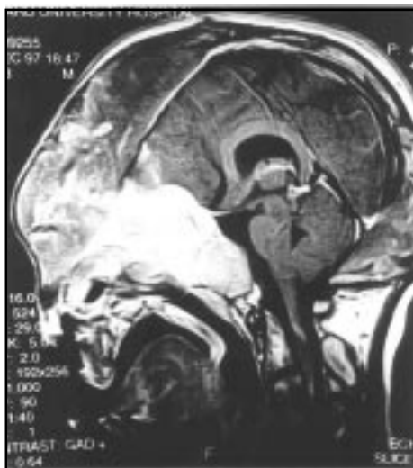
Fig. Nº 2.- RM axial en T1 (1.5T) de estructuras craneales: engrosamiento del hueso frontal y compresión del parénquima cerebral.

En T1 de la RM, las lesiones son típicamente de baja intensidad de señal. En T2 pueden ser bajas, altas o mixtas (21) . Después de la inyección de gadolinio hay un aumento del contraste, el cual usualmente es central (75%) pudiendo también ser periférico (25%).