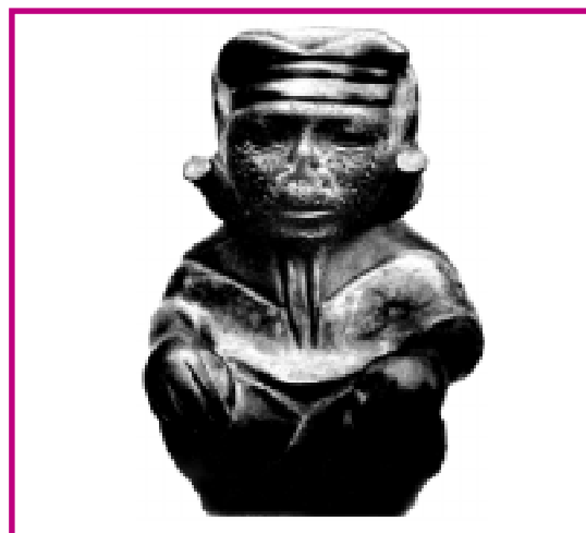
Figura derecha huaco mochica exhibiendo la mutilación de la nariz y labio superior. Signo distintivo la Cruz de Escomel.