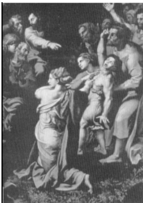
La famosa “postura de esgrimista” observada en la pintura de Rafael. (Copia de la pintura de Rafael: “La Ascención” ubicada en el Museo del Vaticano, Roma, Italia).